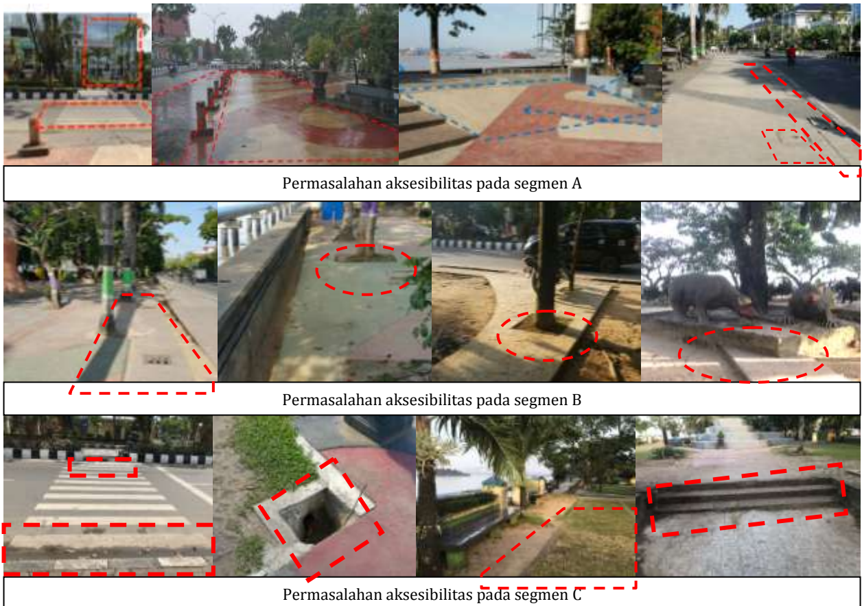
Gambar 5. Kondisi permasalahan aksesibilitas fisik pada Taman Pesut