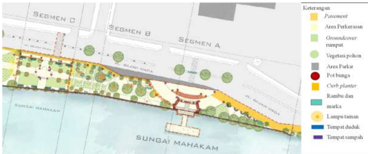
Gambar 2. Lingkungan fisik pada Taman Pesut

Pembahasan tinjauan eksisting ini bertujuan untuk mengetahui tata letak dan elemen-elemen yang ada di dalam taman serta pencapaian, sirkulasi, dan mobilitas pengunjung yang terdapat di lapangan. Pembahasan ini dibagi menjadi 3 (lima) segmen yaitu segmen A, segmen B, dan segmen C.