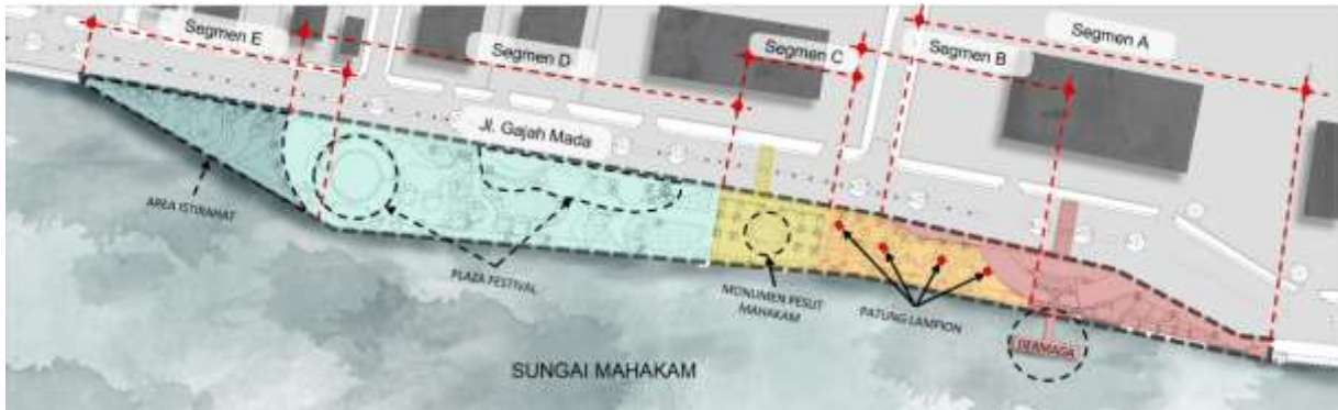
Gambar 1. Pembagian segmen pada lokasi penelitian