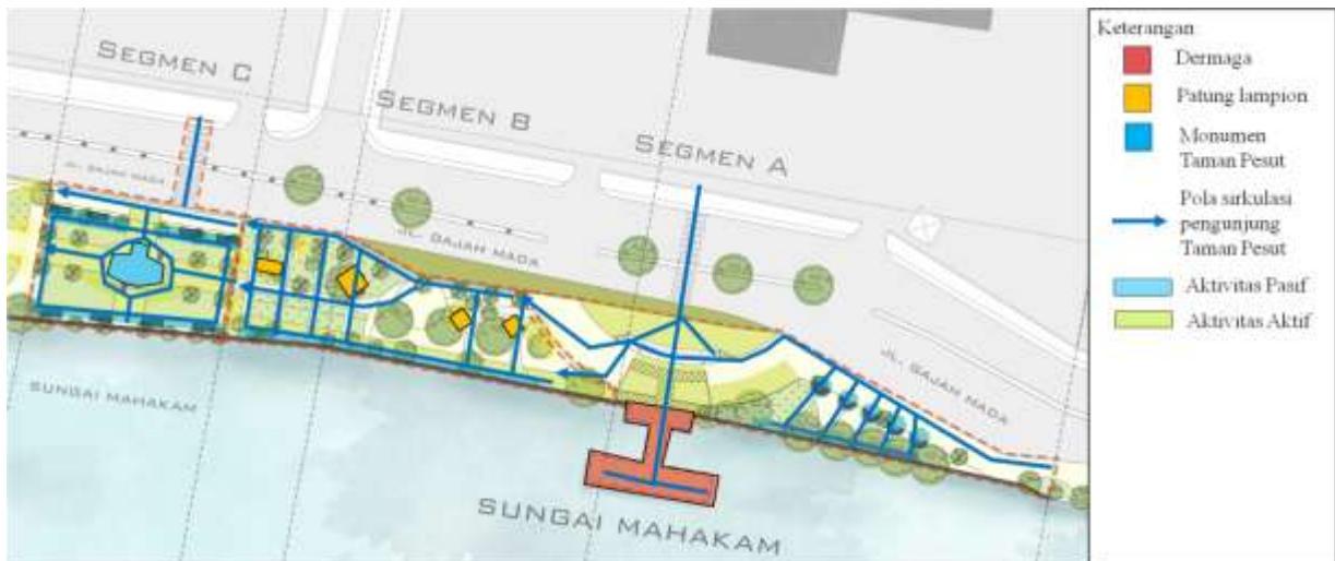
Gambar 4. Aktivitas dan sirkulasi pada Taman Pesut

Secara umum, pencapaian menuju Taman Pesut dari arah seberang jalan hanya bisa dilakukan dari 2 tempat, area penyeberangan jalan yang terdapat pada segmen A dan C, sehingga bagi pengunjung yang ingin menuju segmen B dari arah seberang jalan, harus melalui segmen A atau C. Begitu pula dengan pengunjung yang datang dari arah timur dan barat Taman Pesut. Mereka harus melalui pavement segmen A dan C. Jika dilihat secara garis besar, ini merupakan pencapaian tidak langsung yang membentuk memanjang dari arah Ake C.