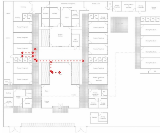
Gambar 3. Hasil Mapping Responden 2