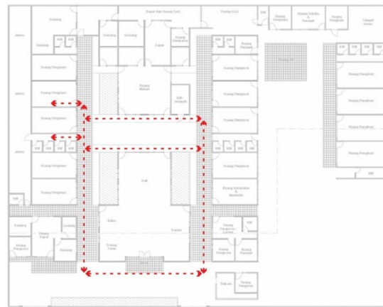
Gambar 5. Hasil Mapping Responden 4