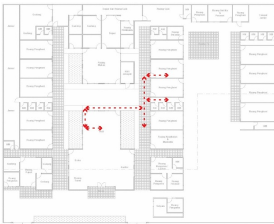
Gambar 6. Hasil Mapping Responden 5