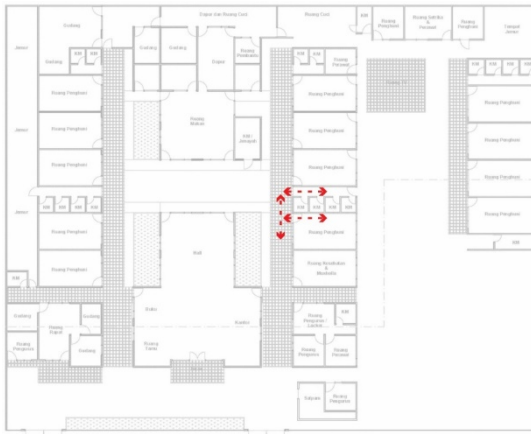
Gambar 8. Hasil Mapping Responden 7