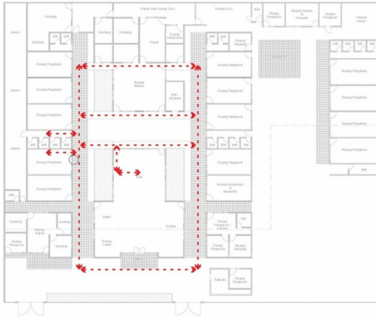
Gambar 2. Hasil Mapping Responden 1

berdasarkan kriteria yang dibutuhkan dalam penelitian, yaitu dapat berkomunikasi dengan baik, dapat beraktivitas secara mandiri, dan bersikap kooperatif. Dari hasil pemetaan aktivitas lansia, didapatkan hasil sebagai berikut: