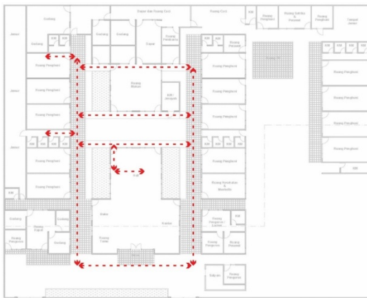
Gambar 4. Hasil Mapping Responden 3