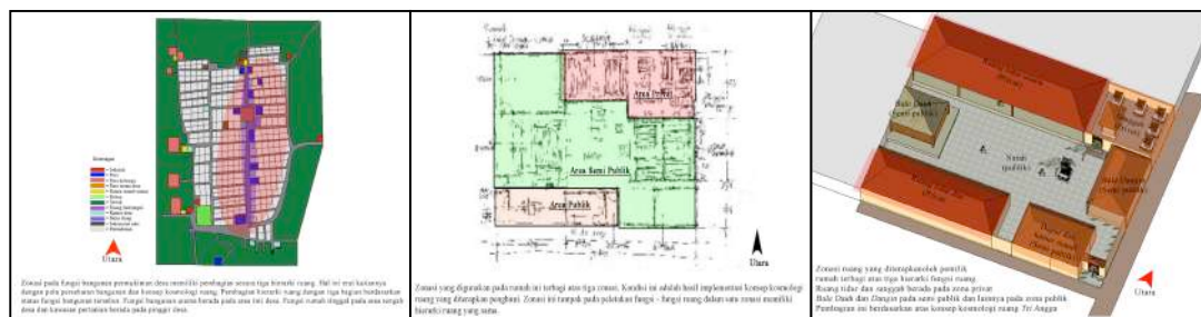
Gambar 2. Sirkulasi pada kawasan desa dan rumah tinggal.

Pada tingkat rumah tinggal, zonasi ruang terbagi dalam dua zonasi dan tiga zonasi. Perbedaan tampak pada penerapan konsep kosmologi ruang oleh pengguna rumah. Selain itu, perbedaan tampak pada letak dan orientasi pada masing – masing zonasi ruang.