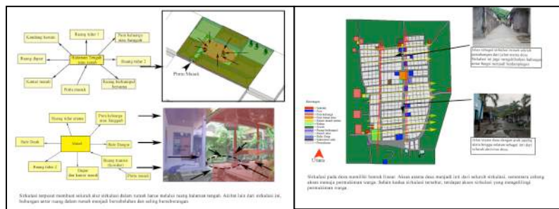
Gambar 2. Sirkulasi pada kawasan desa dan rumah tinggal.

Sirkulasi yang digunakan pada kawasan desa adalah sirkulasi jaringan atau network . Kondisi ini tampak pada peletakan permukiman warga yang saling terhubung. Hubungan antar ruang yang tercipta adalah bersebelahan atau next to . Pada tingkat rumah tinggal, sirkulasi yang digunakan adalah sirkulasi radial. Hal ini dikarenakan posisi ruang dalam pada rumah yang melingkar mengelilingi natah atau sirkulasi utama rumah.