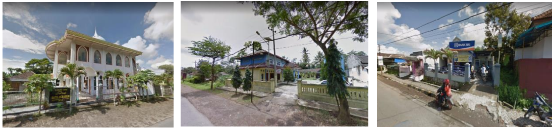
Gambar 2. Fasilitas di Sekitar Tapak