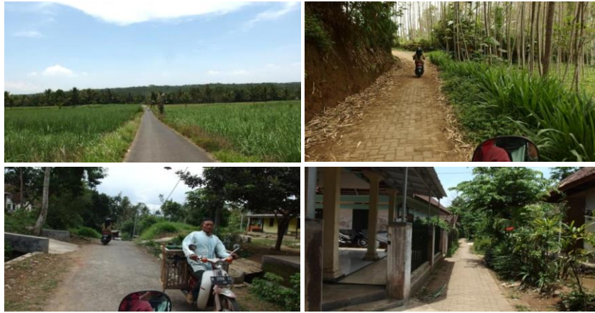
Gambar 3. Akses menuju lokasi

Akses menuju ke dalam Sumber Air Ngembul dapat dikatakan sudah memadai. Kondisi jalan yang cukup lebar sekitar 2 meter dan dapat dilalui kendaraan beroda empat namun hanya satu arah, sedangkan masuk ke dalam jalan permukiman jalan menjadi lebih sempit namun masih muat dilalui kendaraan roda empat. Moda Transportasi paling umum di sana adalah sepeda motor. Untuk menuju Sumber Air Ngembul, belum ada penanda yang jelas sehingga cukup sulit menemukan lokasi jika tanpa bertanya kepada penduduk sekitar.