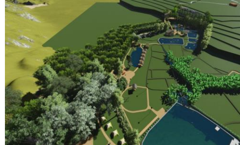
Gambar 4. Siteplan Eksisting Tapak dan Visualisasi Rekomendasi