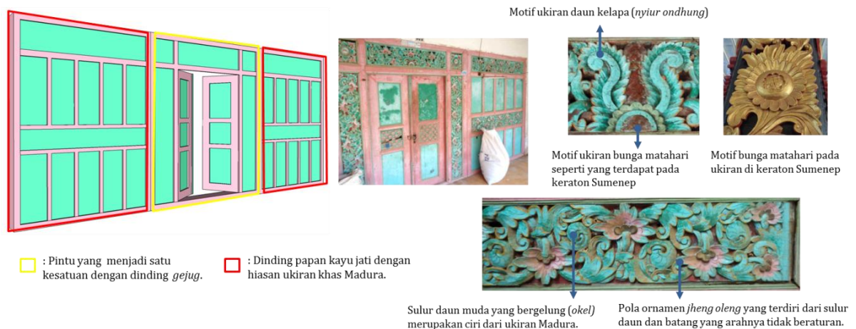
Gambar 2. Elemen Dinding Kayu dan Ornamen Rumah Bapak Habibi

Ukiran yang digunakan pada dinding gejug bermacam-macam jenisnya ada yang berupa motif flora dan ada yang motif fauna, namun motif flora lebih banyak dijumpai. Motif swastika (lambang Buddha) merupakan pengaruh dari Cina dan motif kepetan (bentuk \frac{1}{4} lingkaran yang melambangkan penerangan) merupakan pengaruh dari Jawa. (Gambar 2)