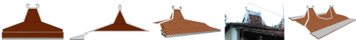
Gambar 6. Elemen Atap Rumah Bangsal

Elemen atap rumah bangsal merupakan hasil perkembangan dari atap joglo lawakan dan joglo sinom Arsitektur Jawa. Perbedaannya atap rumah bangsal pada bagian sisi kanan, kiri dan belakangnya dipotong sehingga atap hanya memanjang pada bagian depan saja. Material penutup atap adalah genteng tanah liat. Ciri dari atap rumah bangsal adalah bubungannya yang memiliki ornamen berbentuk naga. Ornamen tersebut disebut dengan kondhe-kondhe . Bubungan atap rumah bangsal yang menjulang keatas dengan ornament naga ini merupakan pengaruh dari Arsitektur Cina. Atap rumah Madura yang seperti ini disebut dengan atap pacenan . Bentuk ornamen naga tersebut mengambil bentuk naga pada lambang Keraton Sumenep. (Gambar 6)