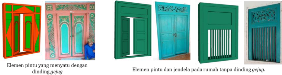
Gambar 4. Elemen Pintu dan Jendela Rumah Bangsal

Elemen pintu yang menjadi satu dengan dinding gejug memiliki papan berukir pada samping kanan-kiri dan atasnya. Pintu ini merupakan pintu utama yang memiliki dua daun (pintu kupu tarung , pengaruh Jawa). Ukuran pintu ini kecil dan hanya dapat membuka ke arah dalam. Hal tersebut menunjukkan bahwa ruang dalam bangunan merupakan ruang yang privat. Ornamen dan warna yang digunakan pada pintu ini sama dengan yang digunakan pada dinding gejug . Pintu berbentuk persegi panjang yang simetris. (Gambar 4)