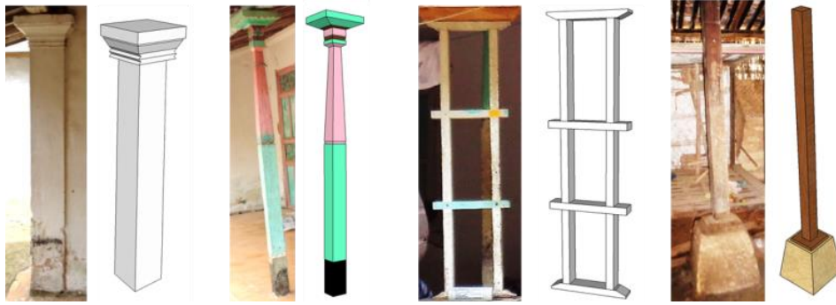
Gambar 5. Elemen Kolom Rumah Bangsal

Kedua, kolom kayu yang berbentuk seperti tangga. Kolom ini mengambil bentuk dasar dari motif swastika pada ukiran di Keraton Sumenep. Warna yang digunakan senada dengan warna pada dinding gejug atau elemen pintu, jendela. Kedua kolom ini terletak pada amper rumah bangsal yang fungsinya untuk menyangga tritisan atap. (Gambar 5)