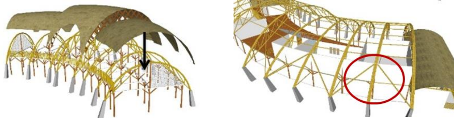
Gambar 2. Konstruksi bangunan

Bentukan atap pada bangunan utama memiliki bentukan lengkung. Untuk mempermudah dalam membentuk atap maka bahan yang dipilih berupa bambu karenan memiliki daya elastisitas yang tinggi. Untuk bagian kolom dan balok menggunakan material kelapa dikarenakan memiliki daya tekan yang kuat. Pada bagian tembok menggunakan material batu kapur untuk menurunkan suhu di dalam ruang dan tetap menjaga privasi.