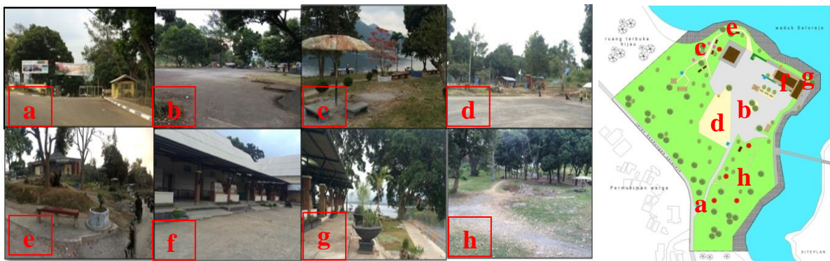
Gambar 2. Kondisi Eksisting dan Siteplan eksisting Kawasan Wisata Waduk Selorejo (a) area entrance , (b) area parkir, (c) area duduk, (d) area playground , (e) area tepi waduk, (f) area kios 1, (g) area kios 2, (h) ruang terbuka hijau

Entrance pada kawasan wisata Waduk Selorejo terlihat kurang jelas. Hanya terdapat dua spanduk yang menandai area entrance tersebut. Pada area parkir, belum terdapat batasan yang jelas antara sepeda motor, mobil, dan bus, serta area parkir terlalu luas dan kurang fungsional. Pada area duduk kondisi dan penataan bangku tidak memadai. Fasilitas furniture di kawasan ini belum tertata dengan baik dan jumlahnya hanya sedikit. Area playground terletak di samping area parkir tanpa ada pembatas pemisah ruang, sehingga keamanan bagi pengguna belum terjamin. Untuk area kios, terdapat kios yang tidak mendapatkan view Waduk Selorejo sehingga kios-kios tersebut kurang diminati pengunjung. Untuk area terbuka hijau, belum terdapat jalur sirkulasi yang jelas dan belum terdapat penataan fasilitas pendukung, sehingga tidak dapat mewadahi aktivitas sosial masyarakat. Selain itu estetika di area terbuka hijau pada kawasan ini masih kurang, karena penataan vegetasi dikawasan ini belum ditata dengan teratur.