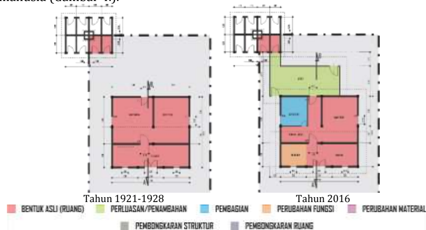
Gambar 4. Perubahan morfologi spasial ruang dalam bangunan Engkle Toekang Woning

Analisis morfologi spasial ditampilkan pada grafis di bawah ini, yang menunjukkan bahwa bentuk asli bangunan masih dipertahankan dan perubahan hanya bersifat perluasan/penambahan ruang, pembagian ruang, dan perubahan fungsi ruang dengan intensitas ringan. Pola perubahan cenderung kedalam dan keluar. Perubahan yang terjadi disebabkan karena faktor kebutuhan, dan gaya hidup (penghuni) manusia (Gambar 4.).