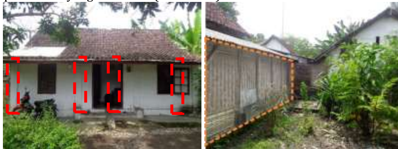
Karakter struktur bangunan Struktur tambahan kolom kayu dinding pemikul Engkle Toekang bangunan Engkle Toekang Woning Woning kondisinya masih sangat yang ditambahakna karena faktor terjaga tanpa perubahan yang berarti. kebutuhan penghuni.

Karakter asli kelompok bangunan Engkle Toekang Woning dengan struktur dinding pemikul dan struktur atap gevel pada bangunan utama dan bangunan pendukung/ keuken . Struktur asli kelompok bangunan Engkle Toekang Woning tidak mengalami perubahan yang cukup berarti, namun seiring dengan terdapatnya perubahan secara spasial dan visual, maka terdapat pula perubahan secara struktural yang bersifat tambahan penambahan struktur baru. Penambahan struktur baru dilakukan dengan mengaplikasikan struktur kolom kayu/bambu. Pengaplikasian struktur struktur kayu/bambu yang dilatarbelakangi faktor kebutuhan yang menyesuaikan dengan pengaplikasian dinding pasangan gedeg anyaman bambu yang membetuk ruang-ruang dalam bangunan. Struktur asli dinding pemikul tidak terdapat perubahan yang dilakukan (Gambar 7.).