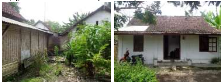
Perubahan visual dengan dilakukan penggunaan material baru dan pengecatan ulang dinding, pintu, jendela. penghubung ruang pada bangunan Engkle Toekang Woning Gambar 5. Foto perubahan visual bangunan Engkle Toekang Woning

Perubahan spasial yang dilakukan dengan ditambahkan ruang baru dengan menggunakan material dengan bentuk dan warna yang berbeda menghasilkan kesan ketidakselarasan dengan material asli bangunan Engkle Toekang Woning . Perubahan dengan intensitas ringan dilakukan dengan penggunaan material dinding pada ruang baru dengan menggunakan material baru berupa multipleks dan gedeg , pengaplikasian bentuk dan material dinding baru disebabkan karena faktor kebutuhan terkait finansial. Perubahan lain dengan intensitas ringan adalah pengecatan kembali dinding menggunakan warna putih sesuai dengan warna asli, dan pengecatan pintu jendela menggunakan warna coklat. Perubahan yang terjadi dikarenakan oleh faktor selera penghuni yang bertujuan agar menjaga keawetan bentuk asli (Gambar 5.).