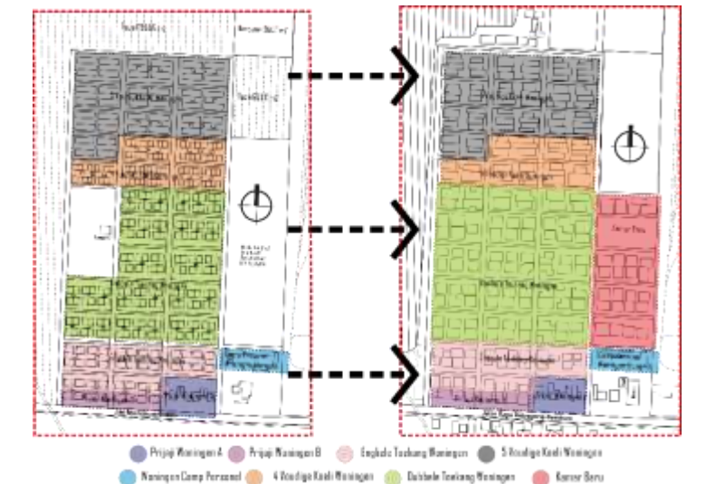
Gambar 2. Peta wilayah perkembangan dan pembagian zonasi Perumahan Kamaran

Pada tahun 1960-an Pabrik Gula Semboro membangun kembali daerah yang kosong di perumahan kamaran lebih tepatnya berada di sisi timur Perumahan Kamaran sebanyak 24 bangunan (48 kamar) rumah tinggal dengan jenis bangunan gandeng/ kopel dua yang saat ini lebih dikenal sebagai Kamar Baru (Gambar 2.).