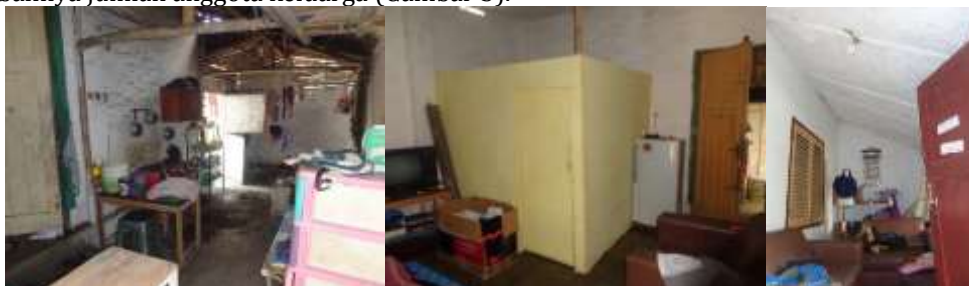
Perubahan spasial berupa penambahan ruang, pembagian ruang, dan perubahan fungsi ruang bangunan Engkle Toekang Woningen .

Secara umum kondisi spasial bangunan rumah Engkle Toekang Woningen adalah sebagai berikut. Bila ditinjau dari karakter spasial bangunan, perubahan paling mencolok adalah dengan ditambahkannya ruang dapur, dan ruang makan dengan ukuran 3,00x7,25. Penambahan ruang yang dilakukan menjadikan bangunan utama dan banggunna pendukung kini menjadi satu kesatuan unit bangunan yang dilatarbelakangi karena kebutuhan penghuni. Perubahan lain yang dilakukan adalah dengan membagi ruang kamar tengah menjadi ruang keluarga dan kamar tidur dengan ukuran 2,50x2,50 meter, dengan tanpa merubahn atau memodifikasi struktur dan bentuk bangunan asli. Pembagian ruang yang dilakukan disebabkan karena faktor kebutuhan penghuni rumah karena bertambahnya jumlah anggota keluarga (Gambar 3).