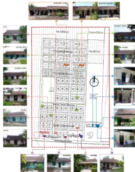
Gambar 1. Kasus bangunan rumah tinggal Perumahan Kamaran.

Dari jumlah total 157 bangunan/ 445 kamar yang didapatkan sebagai populasi dan dilakukan proses pemilihan kasus bangunan kriteria yang telah disebutkan diatas maka di dapatkan sejumlah 15 bangunan rumah/ 28 kamar yang ditetapkan sebagai objek penelitian (kasus bangunan penelitian) terdiri dari 8 bangunan tunggal (8 kamar) yang terdiri dari 1 bangunan Kamar Satu A, 2 bangunan Kamar Satu B, dan 5 bangunan Kamar Satu Tukang; 4 bangunan gandeng/kopel dua (8 kamar) Kamar Dua Tukang; 2 bangunan gandeng/kopel empat (8 kamar) Kamar 4 kuli A; 1 bangunan Tangsi (4 kamar) (Gambar 1.)